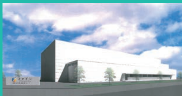
播磨先端製造技術センター(HAMTC) 完成予想イメージ

建設予定の播磨先端製造技術センターは、ファインバイオサイエンス研究所発の新規機能性素材の実用化と製品への応用化を目的として建設し、高齢化社会を迎える日本において健康寿命の延伸に役立つ健康食品、医療用食品などの製品の開発と製造を目的としています。