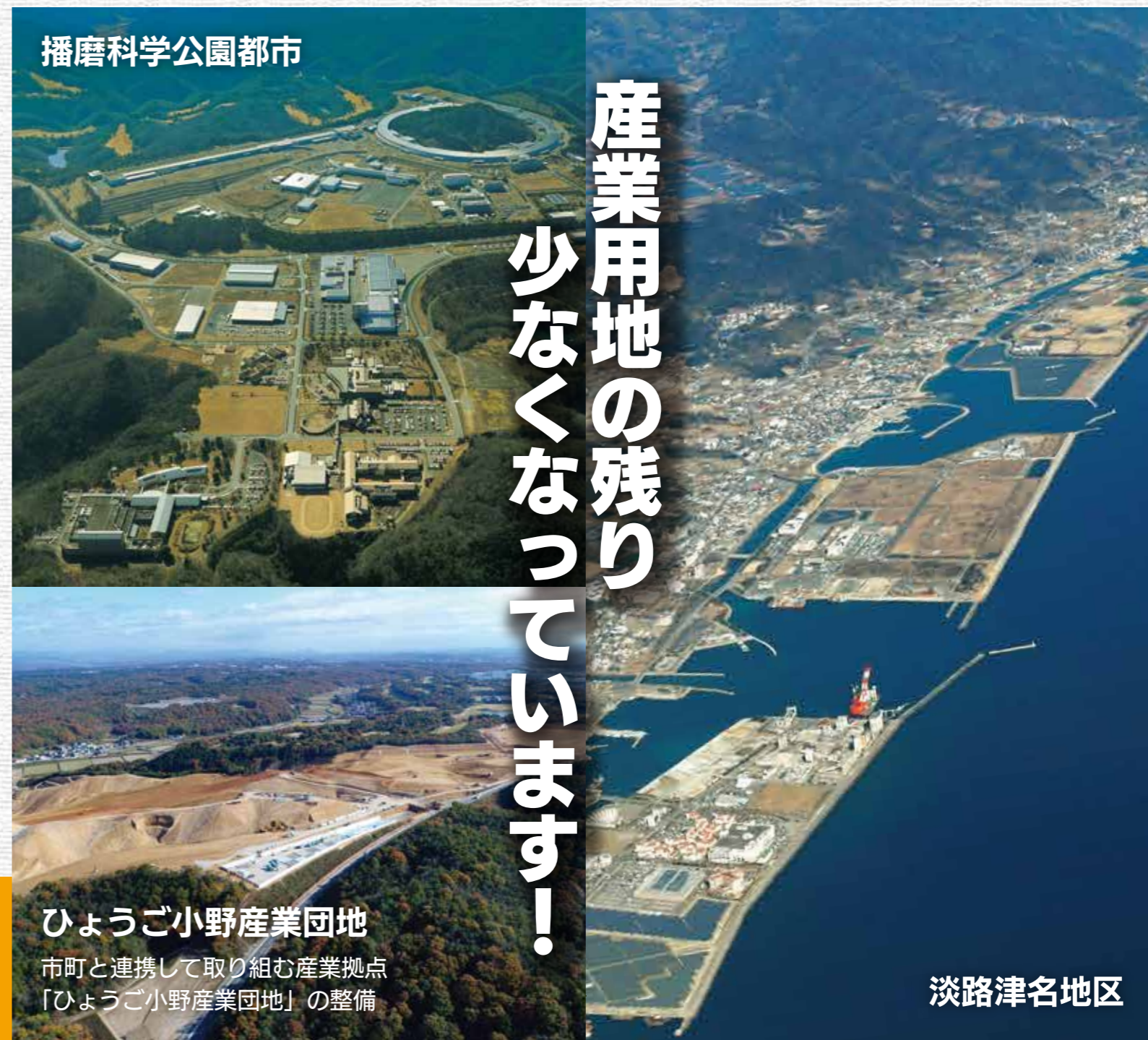
播磨科学公園都市